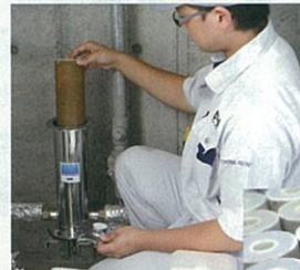
カートリッジ交換作業風景