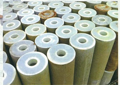
使用済みカートリッジ