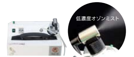
低濃度オゾンミスト